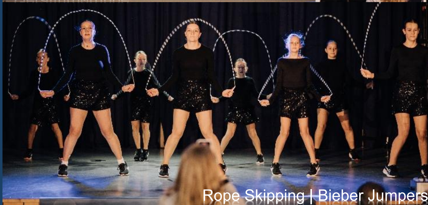
Rope Skipping | Bieber Jumpers